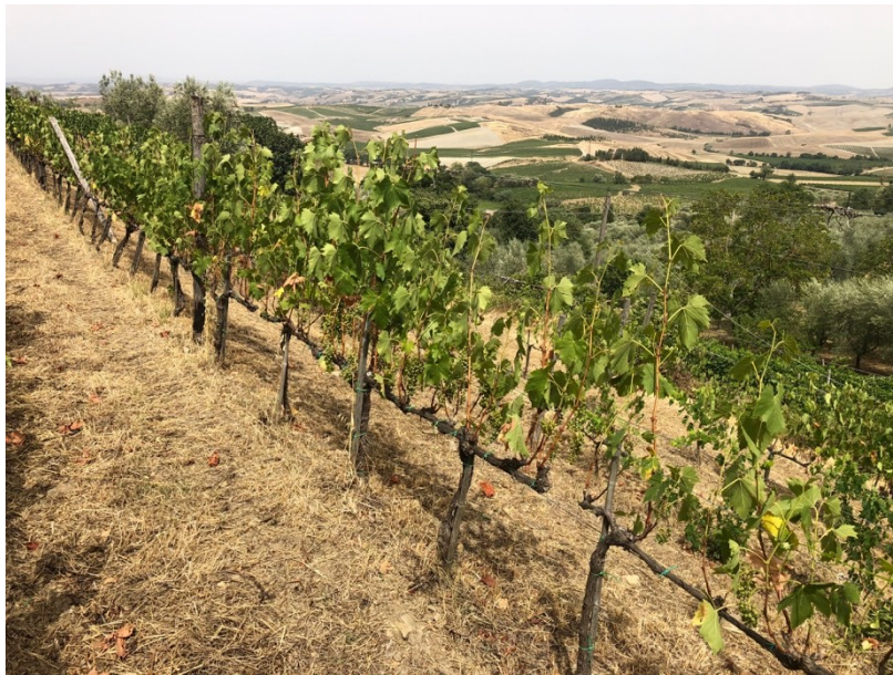
IMMAGINE 2. VIGNETO DI SANGIOVESE CON EVIDENTI SINTOMI DA STRESS IDRICO E TERMICO.